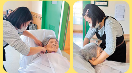
リクライニング車椅子の方も寝たままの状態でもカットしています。