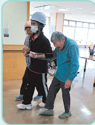
歩ける方は転ばないようにしっかり手を繋いで職員が誘導します。