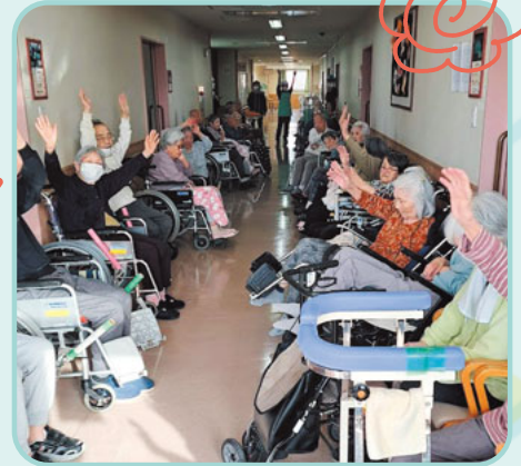
避難場所に全員集合。皆で声をかけあい協力して訓練に参加して頂きました。