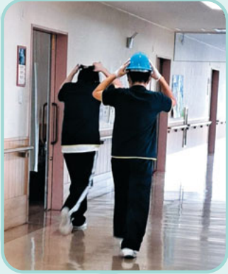
お部屋で休んでいる人の救助に走ります。